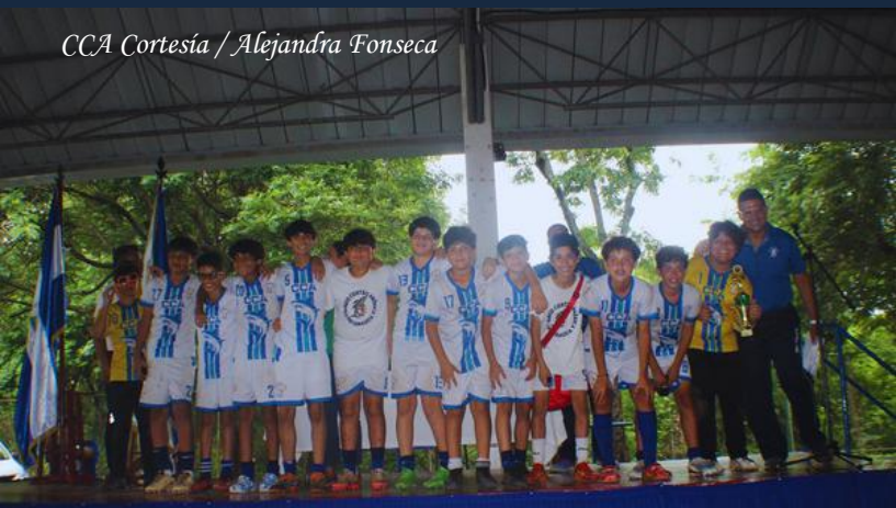
CCA Cortesía / Alejandra Fonseca