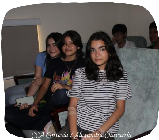
CCA Cortesía / Alejandra Chavarria