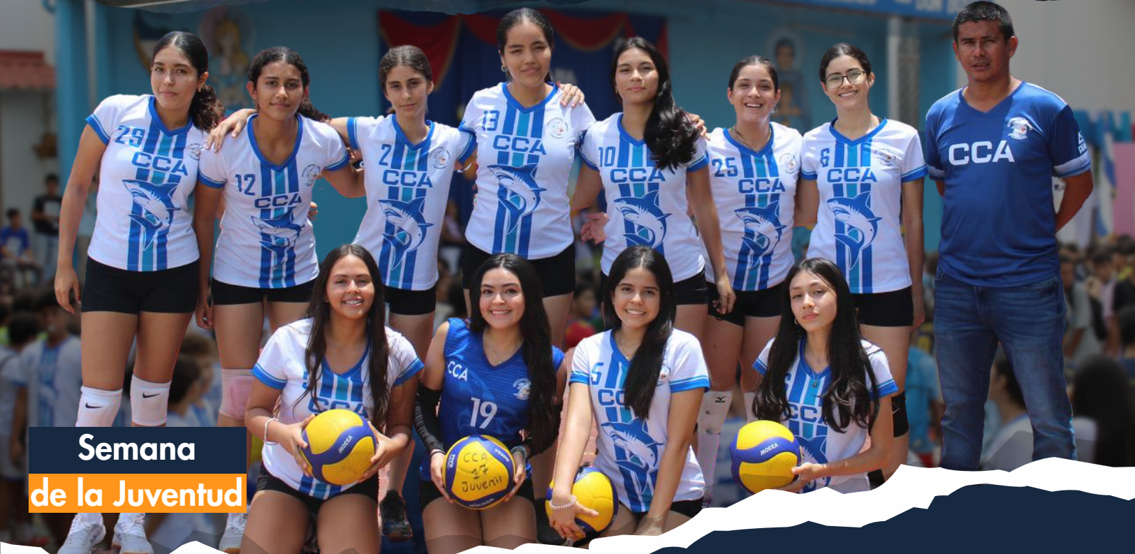
Semana de la Juventud