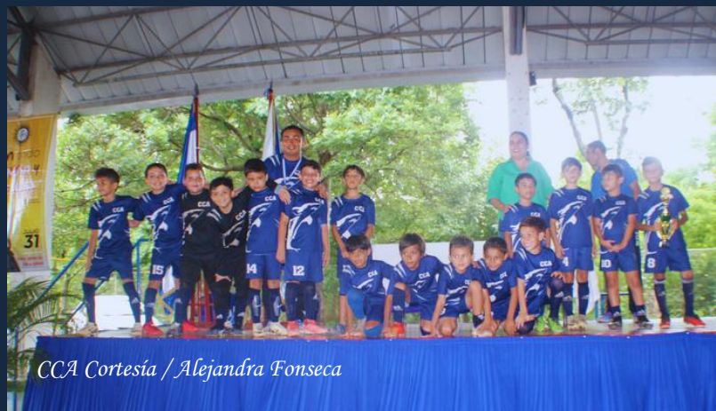
CCA Cortesía / Alejandra Fonseca